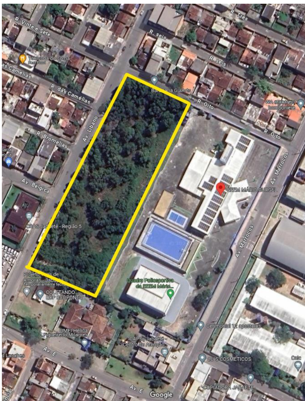
Figura 3) Imagem aérea

O outro terreno está localizado à Avenida Libano, s/n, bairro Jabaeté. Terreno vizinho à Escola EEEM Mário Gurgel e será destinado a construção de uma nova escola para região.