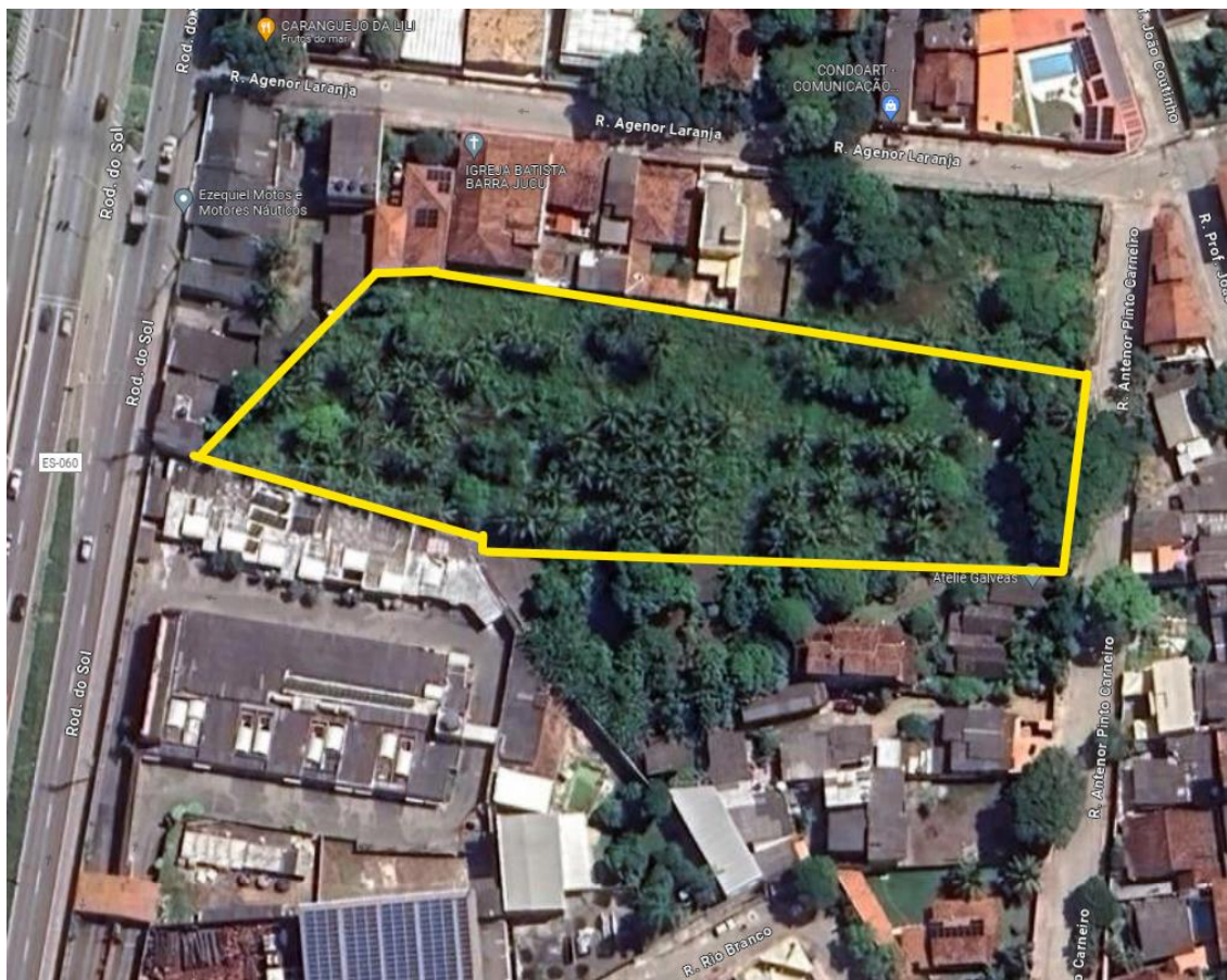
Figura 1) Imagem aérea

Um dos terrenos está localizado à Rua Professor João Coutinho, s/n, bairro Barra do Jucu. Terreno destinado à reconstrução da Escola EEEFM Marcílio Dias.